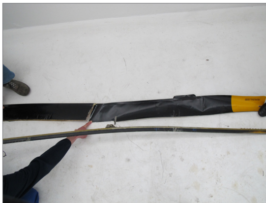
Photo reconstitution pale

Une des deux pales du rotor principal a été reconstituée avec une partie prélevée sur l'épave et le tronçon récupéré en décembre 2011. Les deux parties de la pale sont jointives. L'examen des impacts présents sur son bord d'attaque montre que la pale est entrée en collision avec la partie avant du patin gauche et la verrière. Ce contact n'est possible qu'après la divergence du plan de rotation du rotor principal suite à la rupture de la butée basse des pales principales.