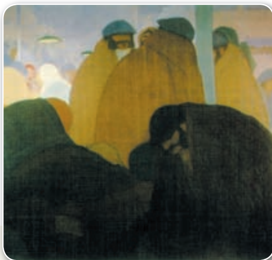
Los inmigrantes de Rafael Barradas. El movimiento sindical uruguayo estuvo vinculado en sus orígenes a la llegada de inmigrantes, muchos de ellos socialistas y anarquistas.