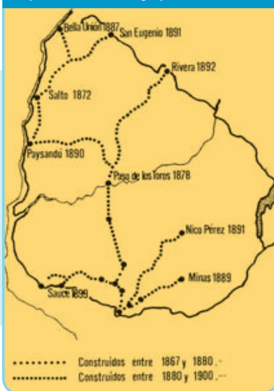
Mapa ferroviario del Uruguay

La predominancia de Montevideo como puerto de exportación hizo que tanto las vías de ferrocarril como las carreteras se trazaran de norte a sur. Se daba prioridad a la salida de los productos frente a las necesidades del transporte de pasajeros. Hoy es frecuente que sea más cómodo y rápido pasar por Montevideo para ir de Fray Bentos a Treinta y Tres, por ejemplo.