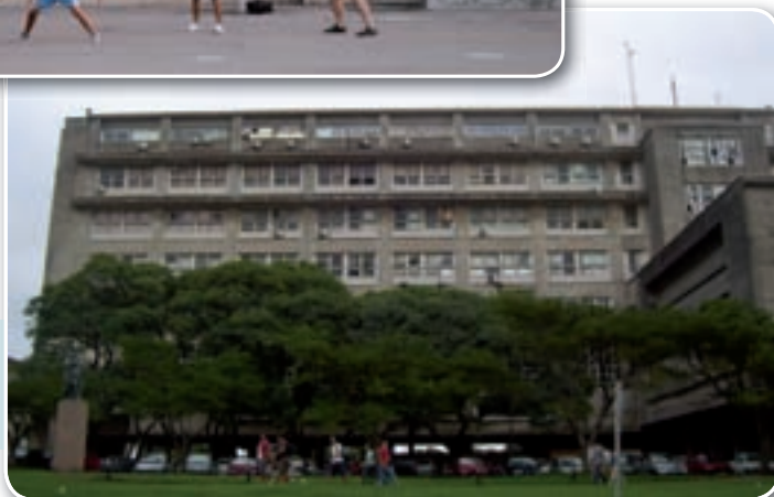
Facultad de Ingeniería.