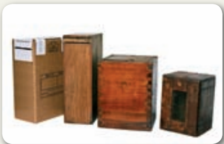
En las elecciones nacionales de 1903, solo votó el 5 % de la población.

Como durante muchos años el Partido Colorado ganó las elecciones, los blancos reclamaban una reforma de la Constitución que estableciera la representación proporcional.