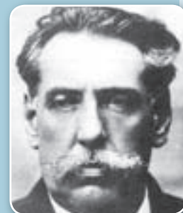
José Batlle y Ordóñez.